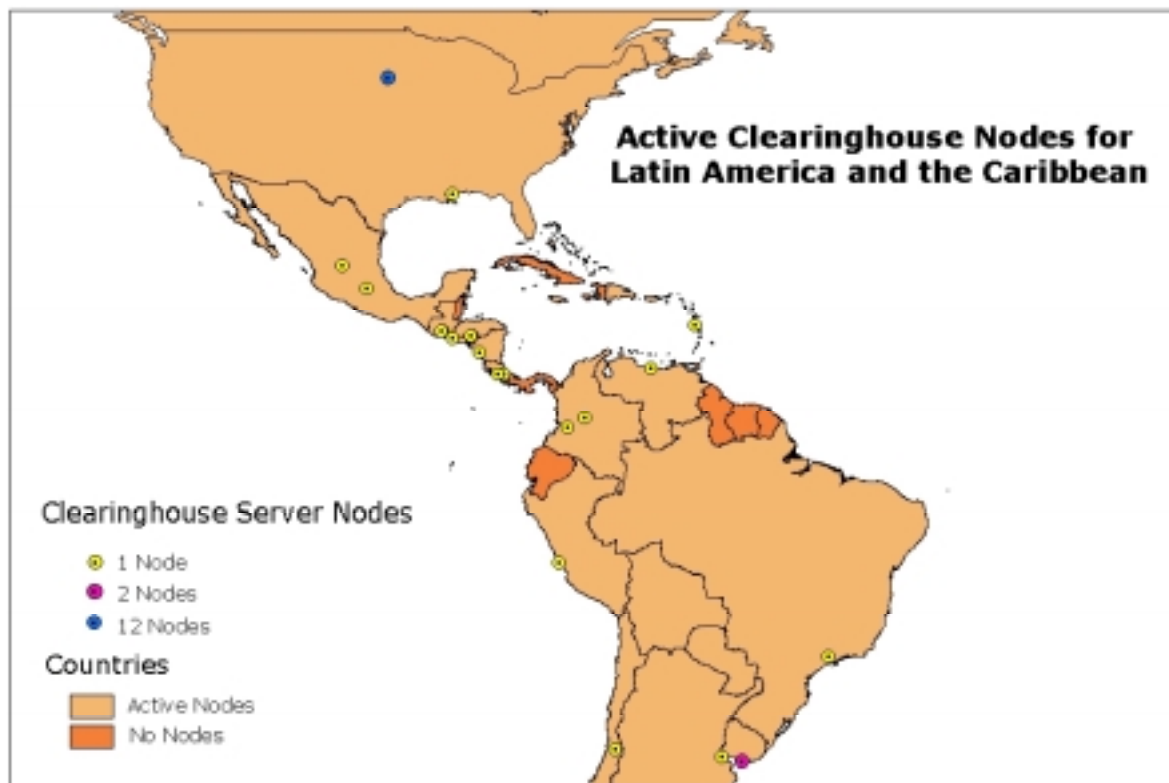
Figura 2. Nodos de clearinghouses activos en América Latina y El Caribe.

La figura 2 muestra un mapa de la localización de los 34 nodos de cleringhouses en América Latina y El Caribe. Como ha habido una estrategia de transferir primero la tecnología de los clearinghouses a los países menos desarrollados, se supone que los países más desarrollados verían los beneficios y lo harían por su propia cuenta—podríamos entonces decir que eso habría funcionado bien. La adopción de la tecnología de los clearinghouses en América Latina y El Caribe, se debe en gran medida a los esfuerzos realizados por los Estados Unidos en transferencia de tecnología. En general los países de mayor desarrollo en América del Sur, además de México, parecen adoptar la tecnología de los clearinghouses por iniciativa propia. Ecuador y Cuba, dos países de tamaño intermedio sin la tecnología de los clearinghouses , están planeando establecer nodos en un futuro cercano.